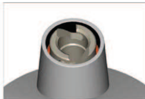
B : Nouvelle version baïonnette Planet Hub